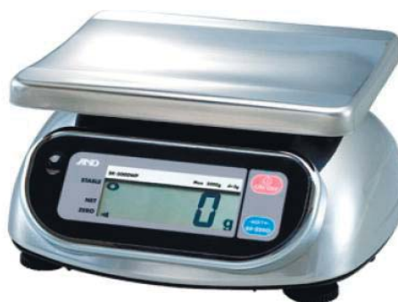
Рисунок 1 – Общий вид весов SK-WP

Общий вид весов представлен на рисунке 1.